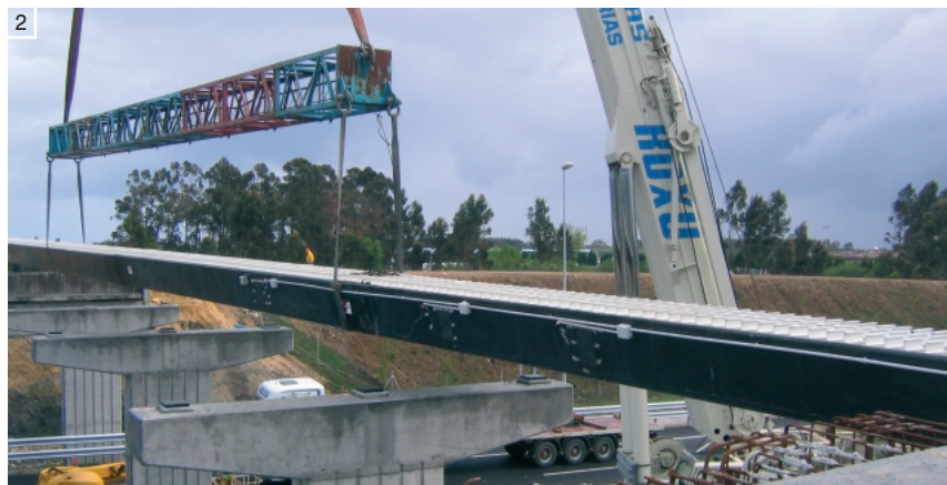
Fot. 1, 2. Most z kompozytów o długości 46 m wykonany na północy Hiszpanii w 2003 roku Fot. 3. Element konstrukcji mostu wykonany z materiałów kompozytowych